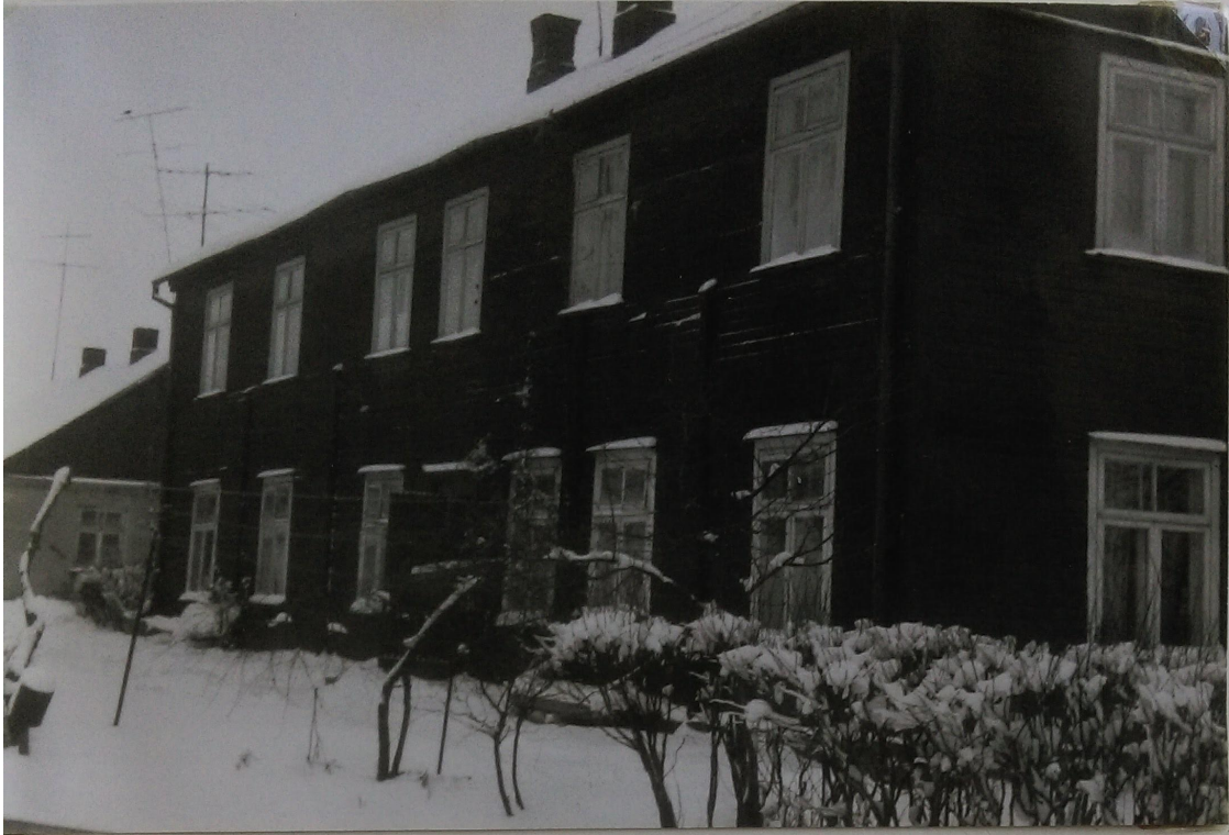
Pastatas Vabalninko g.Nr.1 (vad."Muravanka"). Čia buržuaziniai, fa- šistinės okupacijos ir pirmaisiais pokario metais buvo "Aušros" pradinės mokyklos patalpos.