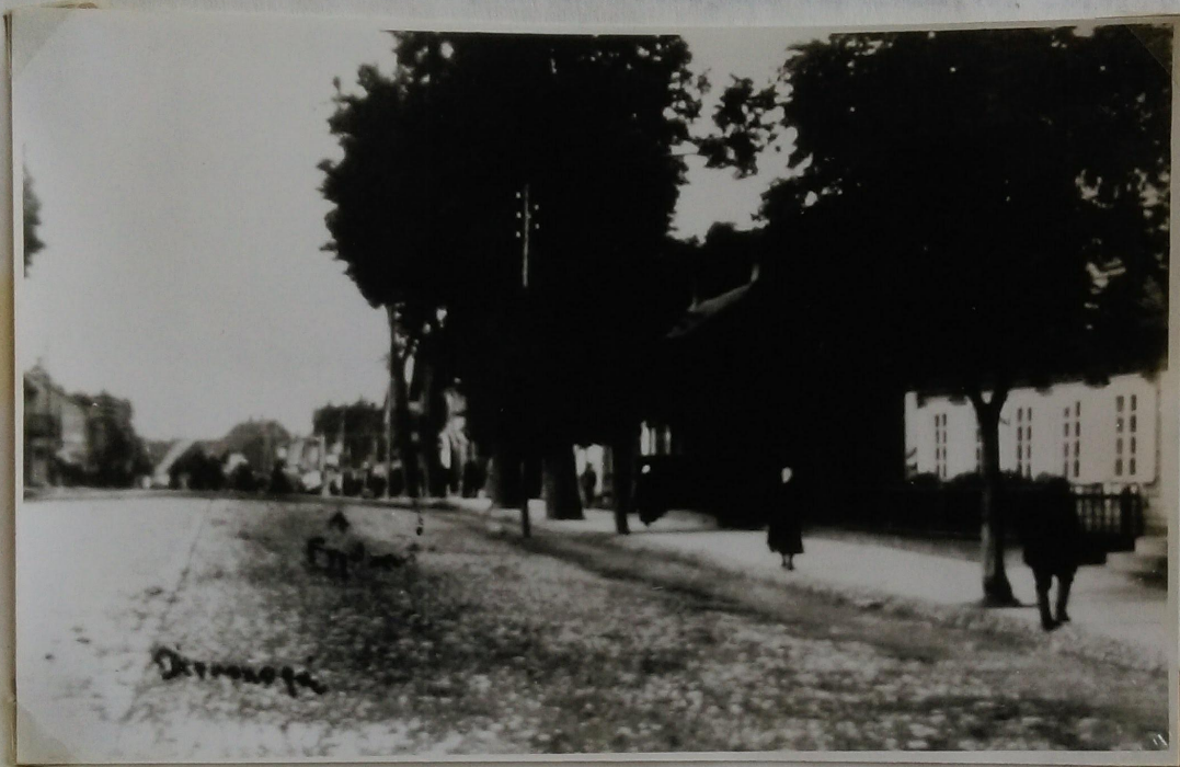
"Aušros" pradžios mokyklos pastatas iš Vytauto gatvės pusės apie 1930m. Nuotrauka nežinomo autoriaus. Kopija da- ryta 1987m. rugsėjo mėn. BGŠK.