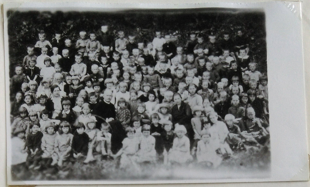
1929m. "Aušros" pradinės mokyklos mokiniai su mokytojomis Stf.Va- siliūnaite ir R.Krikštulyte