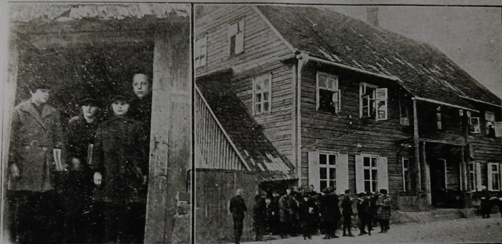
Biržų gimnazija. Kairėje gimnazijos durys; dešinėje, visas gimnazijos namas.

Biržų gimnazija (iki 1930m.), paskui "vištynyčia". Didžiojo Tėvynės karo metais namas sugriautas.