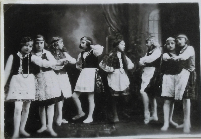
"Aušros" pradinės mokyklos saviveiklininkės (apie 1937 metus)